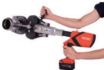
双手柄-更舒适、工作更方便